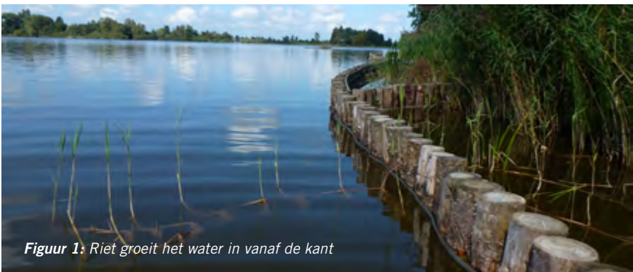
Figuur 1: Riet groeit het water in vanaf de kant

dus elk jaar wordt een kwart van alle nvo's gemaaid. Rijnland laat bewust de vegetatie op de overige nvo's staan. Dit stimuleert dat riet het water in gaat groeien (zie figuur 1 en 2) en dat er zowel jong als overjarig waterriet ontstaat. Overjarig (water)riet is van belang als schuil- en nestgelegenheid voor allerlei dieren, waaronder bijzondere vogels als de grote karekiet en de roerdomp.