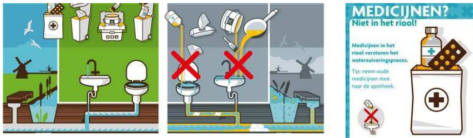
In 2017 ingezette bewustwordingscampagnes

zijn vruchten af. Een voorbeeld is het integrale afvalwaterketen plan Bollenstreek. Ook het onderzoek naar nieuwe stoffen en pilots met innovatieve technieken vorderen goed.