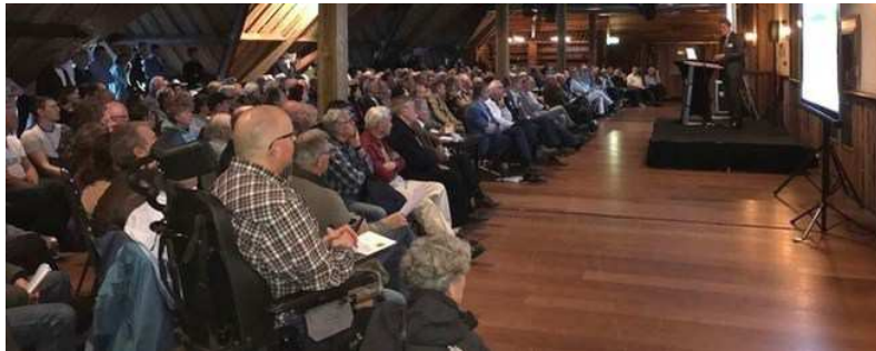
Druk bezochte informatiebijeenkomst piekberging Nieuwe Driemanspolder

uitgaven wat achterlopen op schema. Rijnland is met bijna alle gemeenten in gesprek over het opstellen van een strategische agenda. Bij het grondonderzoek nodig voor de uitbreiding van de KWA is vertraging opgetreden.