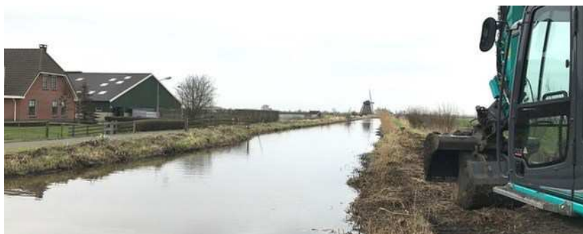
Kadeverbetering Hoogmadese Polder

De activiteiten binnen het programma Waterveiligheid lopen in 2017 volgens planning. Op 31 januari is het officiële startsein gegeven voor de verbetering van de IJsseldijk bij Gouda. Van de regionale keringen is op dit moment 20 km in uitvoering en nog ca 30 km in voorbereiding. De inspectie leefomgeving en transport (ILT) heeft begin 2017 de audit voor de zorgplicht primaire keringen uitgevoerd. Op basis van het eindgesprek verwachten we in het tweede kwartaal een positief oordeel met een aantal verbeterpunten.