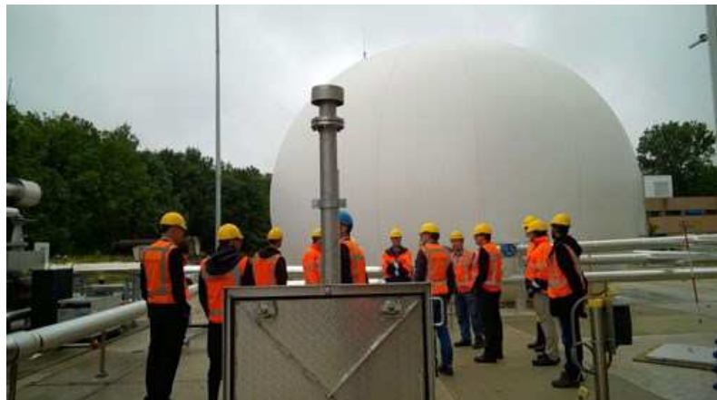
VV-leden op werkbezoek bij awzi Leiden Zuidwest

De werkzaamheden voor het deelprogramma waterketen lopen goed. De meeste vervangingsinvesteringen lopen conform planning. Enkele projecten zijn vertraagd doordat er meer complicaties en onderhoudsachterstanden op de installaties blijken te zijn dan verwacht. De technische maatregelen op het gebied van de gasveiligheid (ATEX) worden naar verwachting eind 2015 afgerond.