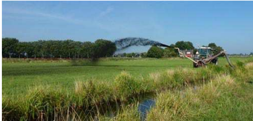
demomiddag baggerspuiten, ecologisch slootschonen, Alphen a/d Rijn

Het programma Voldoende water loopt voor het overgrote deel op schema zoals het programma "voorkomen wateroverlast en peilbeheer", de meeste baggerprojecten en het onderhoud aan kunstwerken. De onteigening en de ontwerpfase voor de piekberging Haarlemmermeer zijn vertraagd, omdat gewacht wordt op de uitkomsten van de actualisatie studie waterbezwaar. Enkele baggerwerken lopen vertraging op, o.a. door de vondst van asbest in een depot en een arbitragezaak c.q. een strafrechtelijk onderzoek tegen twee aannemers.