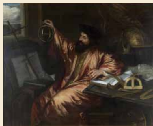
De Mathematicus, door Jan Lievens, circa 1666. Schilderij voorstellende een wiskundige met zijn attributen. Hierin kan een verwijzing naar de landmeter worden gezien, een belangrijke functionaris bij het hoogheemraadschap (Hoogheemraadschap van Rijnland, Leiden)

In de archieven van Rijnland is van bijna alle ambachten een meetverslag uit 1543 of 1544 bewaard gebleven. Alleen van Voorschoten ontbreekt het, evenals van een aantal ambachten langs de Spaarndammerdijk. Deze laatste waren in de jaren