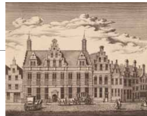
Het gemeentehuis van Rijnland aan de Breestraat in Leiden, door Abraham Rademaker. Gravure uit het in 1732 te Amsterdam verschenen boek Rijnlands fraaiste gezichten