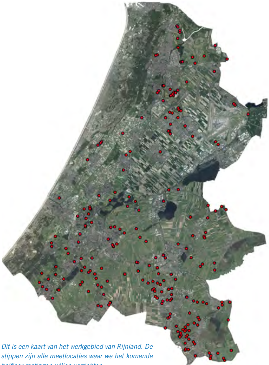
Dit is een kaart van het werkgebied van Rijnland. De stippen zijn alle meetlocaties waar we het komende halfjaar metingen willen verrichten.