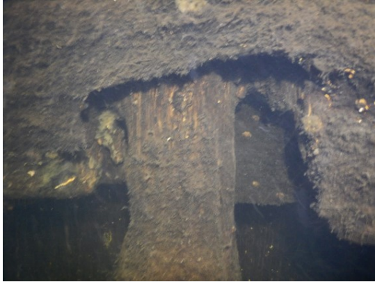
Figuur 2: Deze foto (gemaakt tijdens duikinspectie) laat een funderingspaal en houten sloof zien. In een 'normale situatie' zou het gat opgevuld zijn door de funderingspaal. Duidelijk is te zien dat de funderingspaal in omvang is afgenomen.