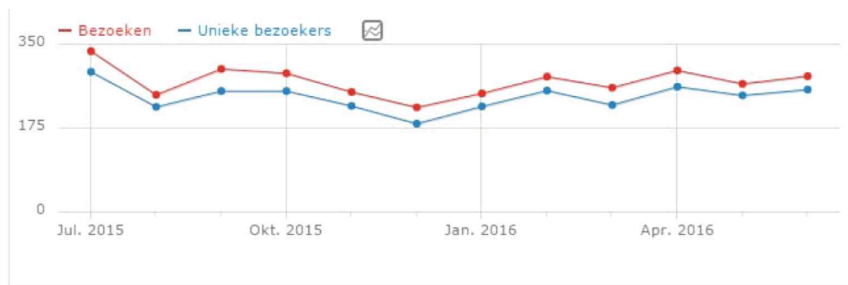
Figuur 2 Bezoeken aan de regelchecker

In aansluiting op de website is in 2015 een speciale regelchecker ontwikkeld. Burgers, bedrijven en medeoverheden worden geadviseerd om gebruik te maken van een regelchecker, waar niet alleen de regelgeving van Rijnland is te vinden, maar ook die van alle gemeenten. Door middel van het invoeren van een locatie en het beantwoorden van enkele vragen wordt snel inzicht verkregen in de vraag of voor een bepaalde handeling toestemming van Rijnland (en van een gemeente) nodig is en zo ja op welke wijze een aanvraag kan worden ingediend. Uit interviews blijkt dat het een goed hulpmiddel wordt gevonden. Als verbeterpunten dragen klanten aan het meer vooraf invullen van informatie en het nog meer verwijzen naar andere regelgeving (bijv. op gebied van waterkwaliteit). Sinds de inwerkingtreding van de nieuwe keurregels wordt goed gebruik gemaakt van de regelchecker (zie figuur 2). Gemiddeld zijn er per maand 270 unieke bezoekers. Er worden vooral veel checks gedaan voor steigers, beschoeiingen en het bouwen bij water.